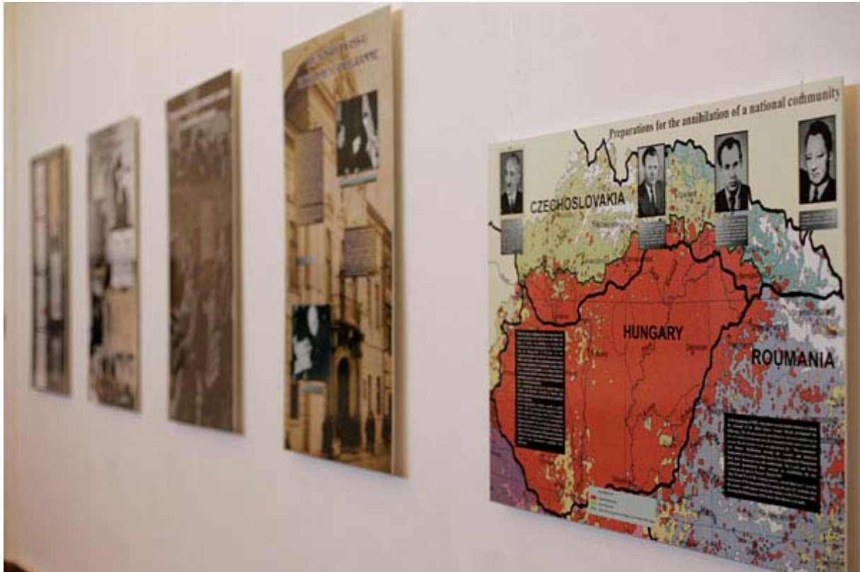
A magyar nemzeti közösségek kiirtásának előkészítései