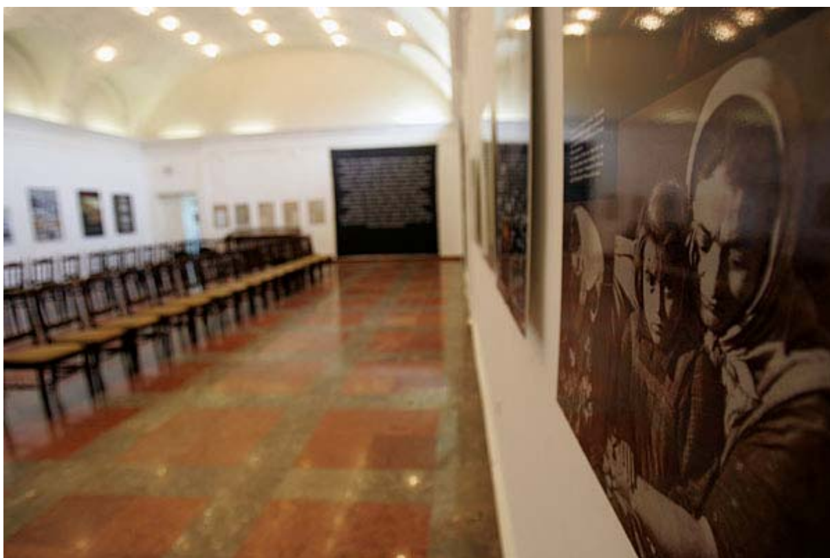
Magukra hagyott magyarok