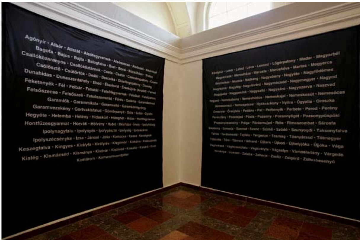
Helyek, ahonnan kitelepítettek