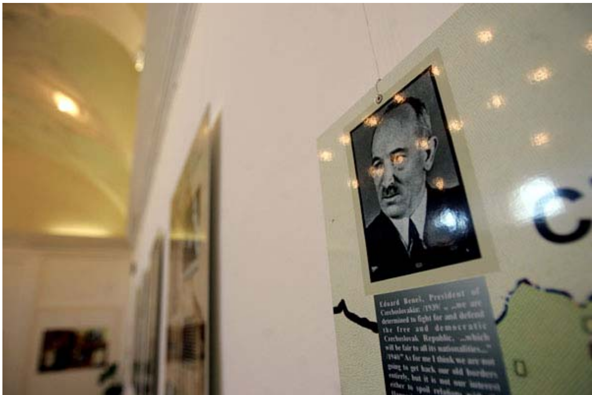
Furcsa fények Benes szemében