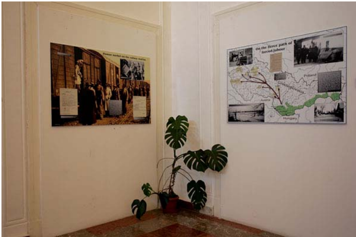
A kényszermunkára és deportáció térképének utjai