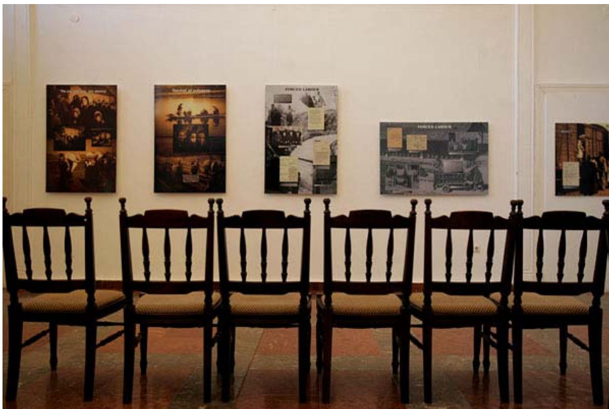
Üres helyek a kiállító teremben