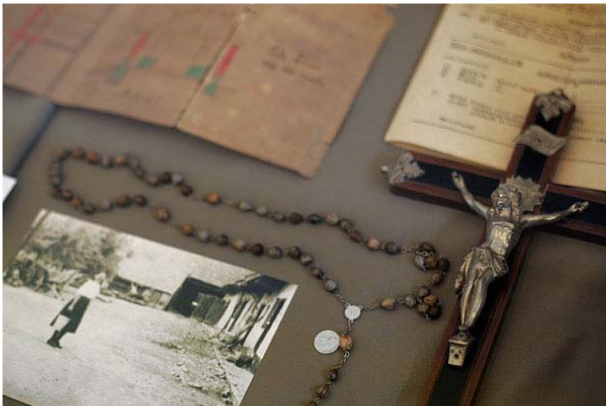
A feszületet elvihették